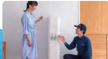
故障などが起きても安心

ウォーターサーバーに不具合が生じた場合は、 スピーディー に対応いたします。もちろん、ちょっとしたお困りごとにも気軽にご相談ください。