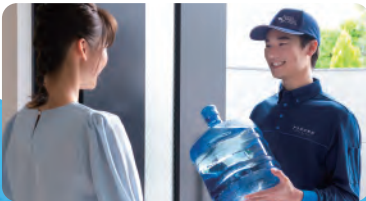
空ボトルの回収もお任せでラクチン!

お水は配送業者ではなく、 専門の宅配スタッフ がお届けにあがります。また、新しいボトルをお渡しする際に飲み終わった 空のボトル も回収いたします。